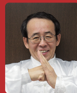
ハウデンコク 包殿国 先生 講師 兵庫医科大学非常勤講師 北京中医薬大学日本語講師