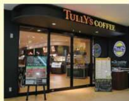
タリーズコーヒー