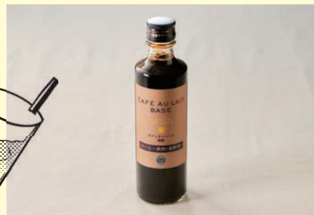
Tully's Specialty カフェオレベース