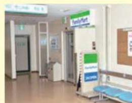
ファミリーマート