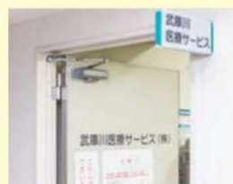
武庫川医療サービス

営業時間：月～金 8時30分～16時45分 第1・3土曜日 8時30分～12時30分 休業日：病院休診日