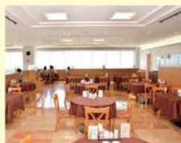
レストラン ROYAL(ロイヤル)

新型コロナウイルス感染拡大防止のため、一部の店舗で営業時間等を変更しております。 最新情報は、病院WEBサイトの「お知らせ」ページをご確認ください。