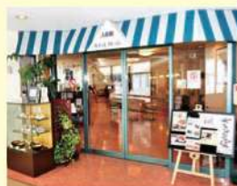
武番館カフェレストラン

営業時間：平日 8時30分～16時 第1・3土曜日 8時30分～14時 休業日：病院休診日