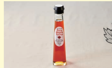
タリーズオリジナル ピュアメープルシロップ 1,188円

外はカリッと、中はふんわりの新パンケーキ生地を、オリジナルブレンドのメープルシロップ、ほどよい塩味とコクのあるバターで楽しむタリーズの新定番。