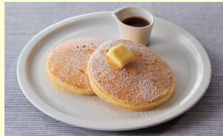
ピュアメープルと バターのパンケーキ 693円 ※テイクアウトされる場合は680円

外はカリッと、中はふんわりの新パンケーキ生地を、オリジナルブレンドのメープルシロップ、ほどよい塩味とコクのあるバターで楽しむタリーズの新定番。