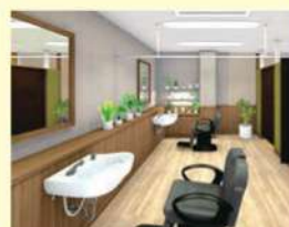
理美容室 ANCS(アックス)