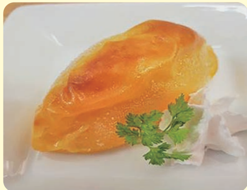
スイートポテト ドリンクセット 300円 ※コーヒーか紅茶をお選びいただけます。