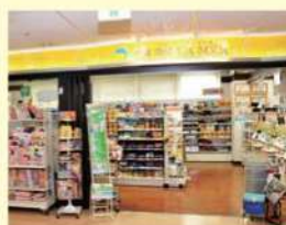
売店 ドゥラ・メール